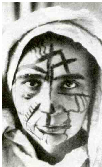
Н.Гончарова. Фото, 1910-е.